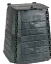
Composteur plastique seul (Photo non contractuelle)