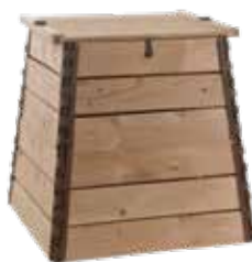
Composteur bois seul (Photo non contractuelle)